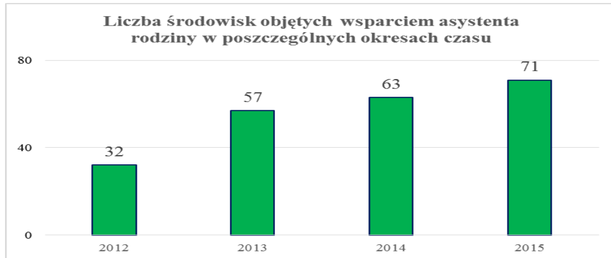
Wykres nr 1. Liczba środowisk objętych wsparciem asystenta rodziny w poszczególnych okresach czasu.

Od 01.01.2015 r. nastąpiła zmiana zapisów art. 15 ust. 4 ustawy z dnia 9 czerwca 2011 r. o wspieraniu rodziny i systemie pieczy zastępczej, zgodnie z którym asystent rodziny może w tym samym czasie prowadzić pracę z 15 rodzinami, podczas gdy wcześniejszy zapis mówił o 20 rodzinach.