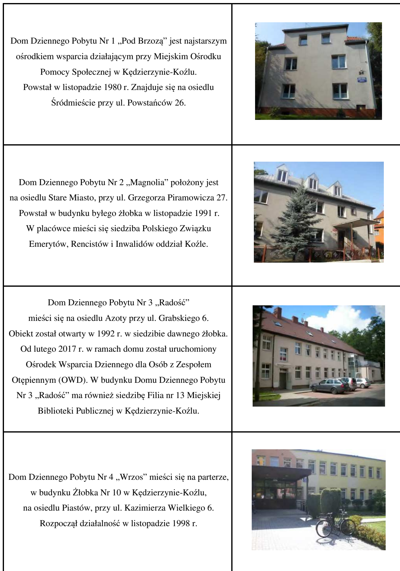
Tabela nr 14. Charakterystyka domów dziennego pobytu w Kędzierzynie-Koźlu