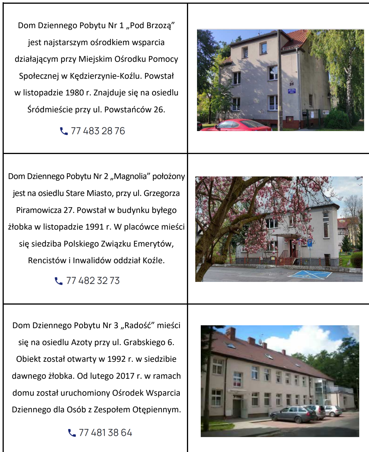
Tabela nr 17. Charakterystyka domów dziennego pobytu w Kędzierzynie-Koźlu

Koźle z dnia 29 grudnia 2016 r. w sprawie ustalenia szczegółowych zasad ponoszenia odpłatności za pobyt uczestników w Ośrodku Wsparcia Dziennego dla osób z zespołem otępiennym, funkcjonującym w ramach Domu Dziennego Pobytu Nr 3 Miejskiego Ośrodka Pomocy Społecznej w Kędzierzynie-Koźlu.